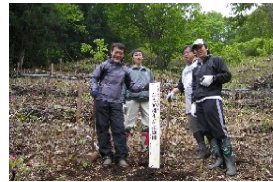
創立30周年記念植樹(2009)