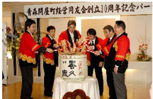
来賓・役員 鏡開き