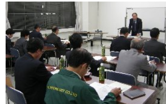
企業会計セミナー(2007)