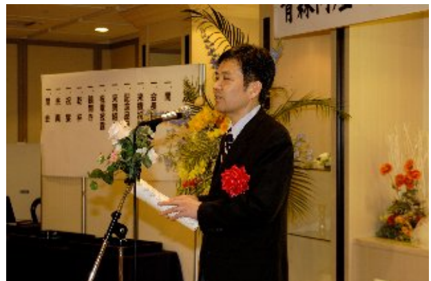
協同組合青森総合卸センター 西副理事長 祝辞