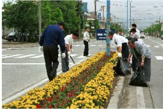
問屋町クリーン作戦(1993)