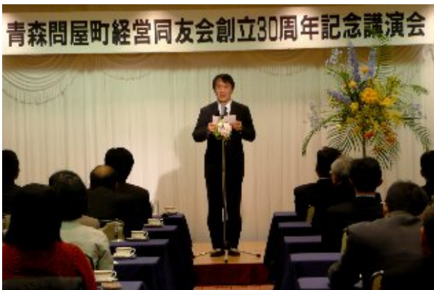
青森問屋町経営同友会 足立会長 記念講演会挨拶