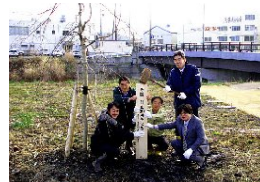
創立30周年記念品のしだれ桜(2009)