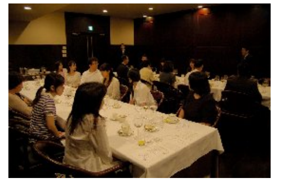
テーブルマナー教室(2007)