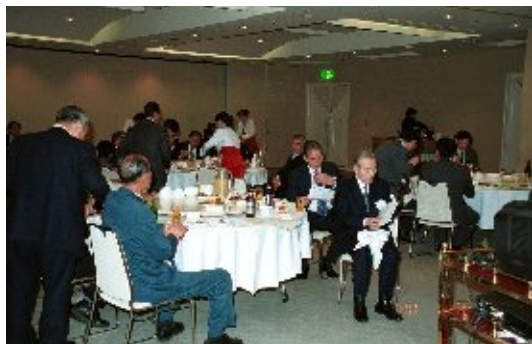
創立20周年記念パーティー(1999)