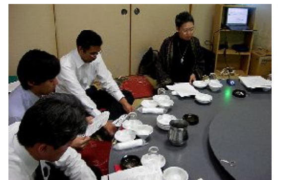
全体会議・心の健康(2006)