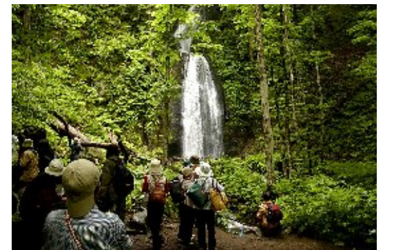
奥入瀬ハイキング(2006)